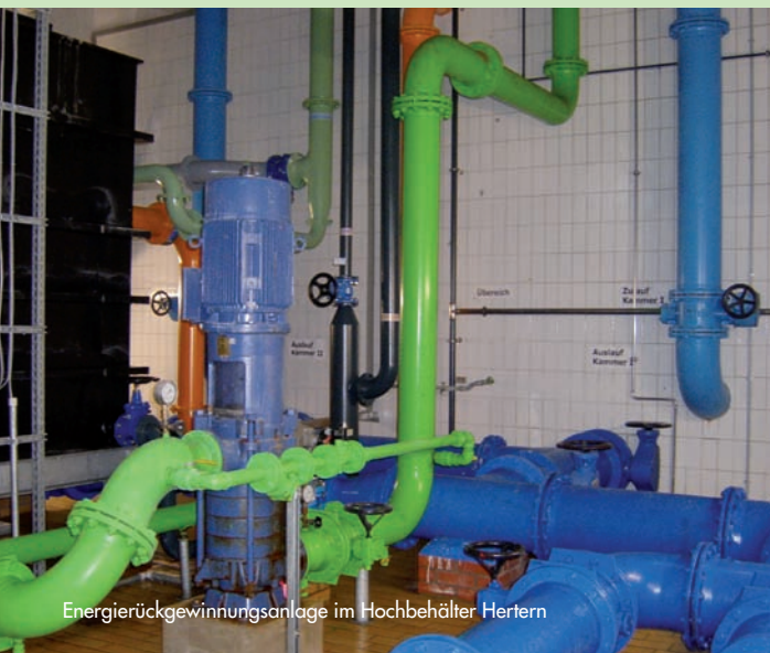
Energierückgewinnungsanlage im Hochbehälter Hertern

Wichtig hierbei ist, dass es keine Gebührenerhöhung gab. Die Kosten der Abwasserbeseitigung und -reinigung können somit verursachungsgerecht ermittelt werden. Sind Sie auf der Suche nach weiteren Einsparpotentialen hinsichtlich Ihrer Niederschlagswassergebühren, dann können Sie sich gerne an uns wenden.